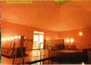
プラザ緑風(大浴場)